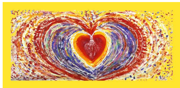
„Wir teilen das sich ausbreitende Herz“