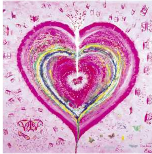
„Wir teilen die Schmetterlinge im Bauch/Herz“