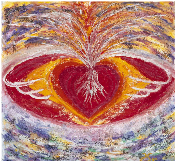
„Das Herz bekommt Flügel“