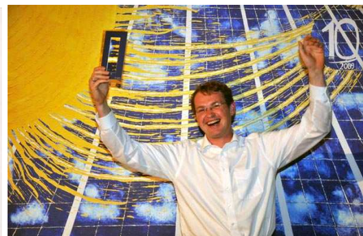
Es können Fotos mit den Einzelteilen vor dem Druck des Kunstwerkmotivs entstehen.